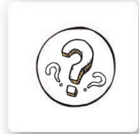
carte (piccole) domande

Prepara le carte contenenti le domande. Posiziona sui vari percorsi le carte (piccole) contenenti le domande (scegline quante vuoi a seconda del livello di conoscenza dei bambini). Puoi metterle ovunque a tuo piacimento. I bambini si spostano casualmente sulle carte. Quando arrivano su una carta domanda contenente istruzioni, chiedigli di rispondere dopodiché leggi ad alta voce la spiegazione.