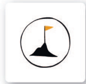
Carta sfida (carta piccola)

Prepara le carte da accoppiare e mescolale. Ogni squadra riceve alcune carte che rappresentano immagini varie che vanno accoppiate. Posiziona sui vari percorsi alcune carte sfida (carte piccole) (scegline quante vuoi a seconda del livello di conoscenza dei bambini). Puoi metterle su qualsiasi casella a tuo piacimento. I bambini si spostano casualmente sulle carte. Quando si arriva su una carta, essa va girata a faccia in su/va accoppiata - chiedi ai bambini di accoppiarla con l'immagine adatta. Risolto il compito, leggi ad alta voce la spiegazione in basso.