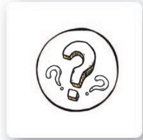
carte (piccole) domande

Prepara le carte contenenti le domande. Posiziona sui vari percorsi le carte (piccole) contenenti le domande (sceglينه quante vuoi a seconda del livello di conoscenza dei bambini). Puoi metterle ovunque a tuo piacimento. I bambini si spostano casualmente sulle carte. Quando arrivano su una carta domanda contenente istruzioni, chiedigli di rispondere dopodiché leggi ad alta voce la spiegazione.