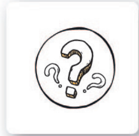
kysymys (pieni kortti)

Valmistelee kysymyskortit. Aseta (pieniä) kysymyskortteja haluamiisi kohtiin pelilaudan polulle. Valitse korttien määrä sen mukaan, minkä arvioit riittäväksi omalle lapsiryhmällesi. Lapset astuvat korttien päälle satunnaisessa järjestyksessä. Kun lapsi osuu kortin kohdalle, käännä ohjeet sisältävä kysymyskortti. Pyydä lapsia vastaamaan ja lue sen jälkeen selitys.